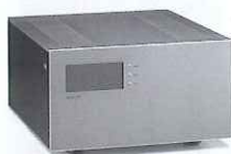
オリジナルのリニア補正アンプ回路を採用したパワーアンプ710(¥5,460,000)